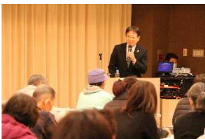
市民公開講座 地域住民を対象としたリハ普及